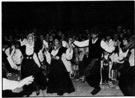
Φωτογραφία από το συγκρότημα νέων της Κύμης που χορεύει στην πλατεία κουμιοτίκων χορούς στην Αγροτική έκθεση που έγινε στην Κύμη 6-8 Σεπτεμβρίου.