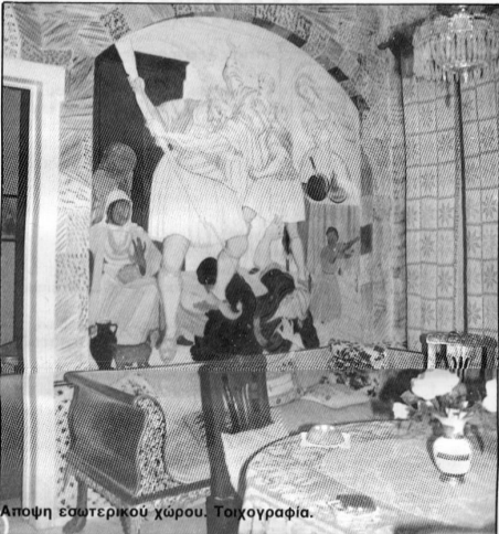
Αποψη εσωτερικού χώρου. Τοιχογραφία.