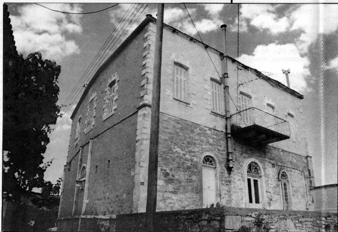
Το κεντρικό κτίριο στον Πάνω Πύργο.