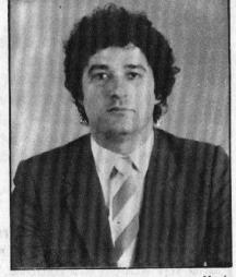
Και πάλι Δήμαρχος ο κ. Χρήστος Θεοδώρου

Με άνετη πλειοψηφία επανεξελέγη Δήμαρχος Κύμης για δεύτερη τετραετία ο κ. Χρήστος Θεοδώρου. Ο συνδυασμός του «ΔΗΜΟΚΡΑΤΙΚΗ ΠΡΩΤΟΒΟΥΛΙΑ ΚΥΜΑΙΩΝ» συγκέντρωσε το 60,5% των ψήφων, έναντι 39,5% του συνδυασμού «ΑΔΕΣΜΕΥΤΗ ΑΝΑΝΕΩΤΙΚΗ ΚΙΝΗΣΗ ΚΥΜΑΙΩΝ» του κ. Δημητρίου Τρίμη. Προς τιμήν των δύο αντιπάλων συνδυασμών, ο προεκλογικός αγώνας διεξήχθη σε ήμερο κλίμα, γεγονός που αναβαθμίζει τα πολιτικά μας ήθη. Τα αναλυτικά αποτελέσματα των δημοτικών εκλογών της 14ης Οκτωβρίου 1990, στο Δήμο Κύμης, δημοσιεύονται στη σελίδα 3.