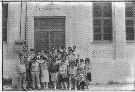
Οι παλαιοί συμμαθητές μπροστά στο Γυμνάσιο

Η συνάντηση έληξε με την υπόθεση όλων συντομώματα να πραγματοποιηθεί και άλλη.