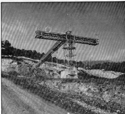
ΚΟΙΣΕΛΙΚ: Τα μηχανήματα «μιλάνε» για παραγωγή...

Μέχρι σήμερα έχουν εξαχθεί 15.000 τόνοι περίπου ενώ μετά την ολοκλήρωση της επένδυσης αναμένεται παραγωγή 100.000 τόνων ετησίως για πέντε τουλάχιστον χρόνια, ενώ παράλληλα θα προετοιμάζονται και άλλα κοιτάσματα για εκμετάλλευση. Στο πρόγραμμα της ΚΟΙ.Σ.Ε.ΛΙ.Κ. έχει ενταχθεί η εκμετάλλευση των δυο μεγάλων κοιτασμάτων ΕΝΤΣ και ΑΘΑΝΑΤΟΣ. Για το δεύτερο η εταιρία έχει ενταχθεί στο πρόγραμμα VALOREN των Ευρωπαϊκών Κοινοτήτων για τη μελέτη και εμπλουτισμό του κοιτάσματος.