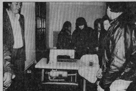
Μια γερμανική ραπτομηχανή συγκεντρώνει το ενδιαφέρον.

Ο Δήμαρχος και το Δημοτικό Συμβούλιο της Κύμης εύχονται σε όλους καλές γιορτές και ευτυχημένο τον καινούργιο χρόνο