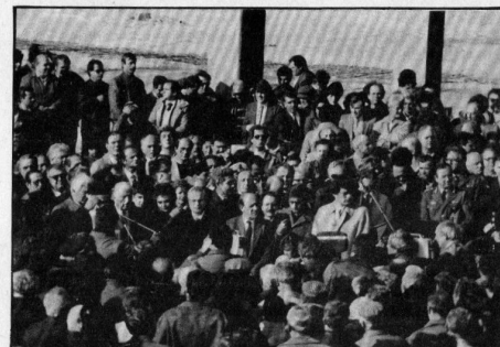
Από τα εγκαίνια του νέου εργοστασίου