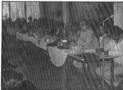
Στιγμιότυπο από τη Συνέλευση.

Παρευρέθηκαν ο Υπουργός Ενέργειας και Φυσικών Πόρων κ. Ευάγγελος Κουλουμπής, ο Α' Αντιπρόεδρος της Βουλής κ. Μιχάλης Στεφανίδης, ο Νομάρχης Ευβοίας κ. Ευτύχιος Κοντομάρης, ο Γενικός Διευθυντής του ΙΓΜΕ, εκπρόσωποι της