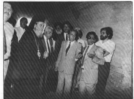
Από τα εγκαίνια της ΚΟΙΣΕΛΙΚ

Στην ανακοίνωση αναφέρεται επίσης ότι οι έρευνες θα συνεχιστούν στην περιοχή «Εντζε», στα πλαίσια του πενταετούς προγράμματος ερευνών 1988-92. Αξίζει επίσης να αναφερθεί ότι σε γέωτρηση που έγινε σε ένα τμήμα του «Εντζε» βρέθηκε κοιτάσμα καθαρού λιγνίτη πάχους 5 μέτρων ενώ στο «Χαροκόπου» το πάχος φθάνει τα 3,40 μέτρα. Όπως καταδεικνύεται από τα παραπάνω, η βιωσιμότητα της ΚΟΙΣΕΛΙΚ θα πρέπει να θεωρείται εξασφαλισμένη, δεδομένου ότι οι έρευνες συνεχίζονται, και υπάρχει αισιοδοξία για την ανακάλυψη και άλλων κοιτασμάτων που θα επιτρέψουν την εκμετάλλευση και πέραν της πρώτης περιόδου των 18 ετών.