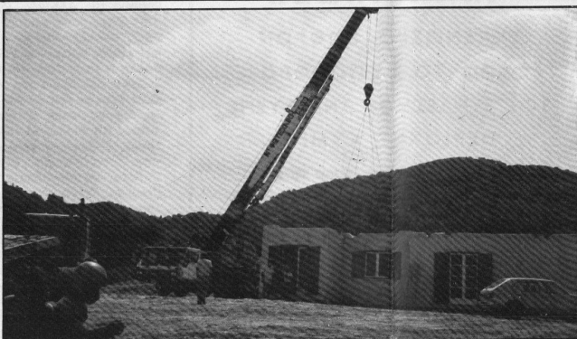
Εγκατάσταση γραφείων στο εργοστάσιο της ΕΒΟ (Προκάρ. κατασκευή)

Στις 19 Νοέμβρη έγινε στην Αθήνα στα γραφεία της ΕΒΟ η δημοπράτηση των κατασκευαστικών τμημάτων του εργοστασίου της στην Κύμη. Το έργο ανέλαβε η εταιρεία ΣΓΑΡΔΕΛΗΣ.