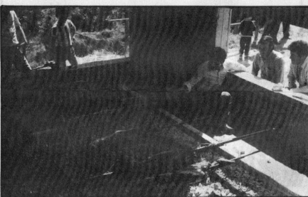
Το φαγητό ετοιμάζεται...

Η Εργατική Πρωτομαγιά στην Κύμη γιορτάστηκε φέτος πανηγυρικά στο νέο χώρο αναψυχής του δάσους Κρύου. Οι μαζικοί φορείς της Περιφέρειας - Δήμος Κύμης, Ένωση Οικοδόμων και Συνάφικων Επαγγελματιών Περιφέρειας Κύμης, Συνεταιρισμός Συκοπαραγωγών Περιφέρειας Κύμης, Σωματείο Εργαζομένων ΚΟΙΣΕΛΙΚ, Μορφωτικός Σύλλογος Κύμης, Κινηματικός Σύλλογος, Ένωση Γυναικών Ελλάδος, Σύνδεσμος Ανάπτυξης Περιφέρειας Κύμης - κέλεσαν το λαό της Κύμης να γιορτάσει ομαδικά την Πρωτομαγιά, και οι Κοιμωτίες ανταποκρίθηκαν στο κάλεσμα με πρωτοφανή μαζικότητα και πλημύνησαν την ειδικά διαμορφωμένη περιοχή του δάσους. Εκεί η Οργανωτική Επιτροπή είχε προστοιμάσει χώρο για ψήσιμο αρνιών, που πληρώσε όλες τις απαιτήσεις πυρασφάλειας, αλλά και προστασίας του τοπίου.