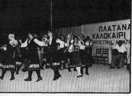
Από τις εκδηλώσεις ΠΑΤΑΝΑ - ΚΑΛΟΚΑΙΡΙ '84

• Στα πλαίσια των εκδηλώσεων «ΠΑΤΑΝΑ - ΚΑΛΟΚΑΙΡΙ '84» ο Πολιτιστικός Σύλλογος Πατάνων οργάνωσε στις 14 Ιουλίου στο Αθλητικό Κέντρο Πατάνων λαϊκή συναυλία με τη μεγάλη ερμηνεύτρια της Δημοτικής μουσικής με παράδοση Δόμνα Χαμιά και το χορευτικό συγκρότημα της Ελένης Τσαούλη. Ήταν μια έξοχη παράσταση που χειροκροτήθηκε θερμά από τον κόσμο. Επίσης στις 21 Ιουλίου έγιναν τα εγκαίνια έκθεσης παιδικού βιβλίου, χειροτεχνίας, κεντημάτων και κουκουλιάρων. Η έκθεση που σημειώνει μεγάλη επιτυχία θα συνεχισθεί μέχρι τις 20 Αυγούστου.