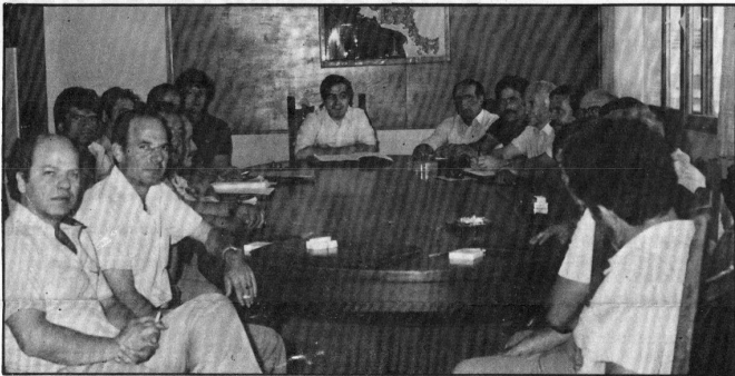
Στην φωτογραφία οι εκπρόσωποι των Κοινοτήτων που μετέχουν στην εταιρία, με το Νομάρχη, σε μια από τις συσκέψεις τους.