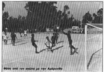
Φάση από τον αγώνα με την Αμάρυνθο

Ως γνωστόν, η Κύμη είχε κάνει ένσταση για κακή συμμετοχή, λόγω τιμωρίας, σύμφωνα με την κατάσταση τιμωριών της Ε.Π.Σ.Ε.Β. ποδοσφαιριστή του αθλητικού ομίλου Πούρνου στον μεταξύ τους αγώνα.