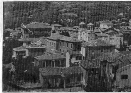
Κύμη: το μαλκόνι του Αιγαίου

Ο Δήμος Κύμης θεωρεί αναγκαίο να δοθεί στους ιδιοκτήτες των κτιρίων αυτών