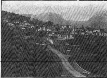
Άποψη του ΚΟΙΛΙΟΥ

Στους πρώτους νικητές δόθηκαν μετάλλια και βιβλία για την Ειρήνη, ενώ ο σ' όλους που πήραν μέρος απονεμήθηκε αναμνηστικό βραβείο συμμετοχής.